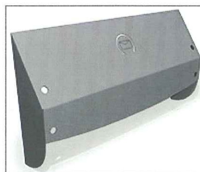
Brievenbusbeveiliging Plus (met post 'uit' lip) RAL9006